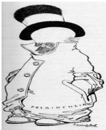
Fig. 3.1. “El abrigo de moda. –Queda un poco grande... pero así es la moda” en El Multicolor, 1911. Obra de Ernesto García Cabral.