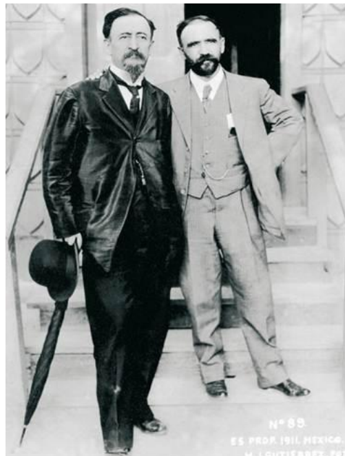
Fig. 2.1. Francisco Ignacio Madero González con su padre Francisco Madero Hernández. Nótese el parecido, pero también la diferencia en estatura. S.f.